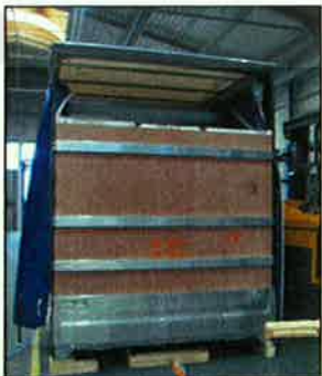
Heckwand mit XL PIN