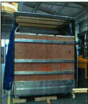
Heckwand mit XL PIN