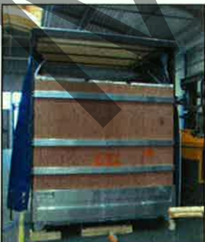
Heckwand mit XL PIN