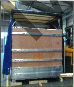
Heckwand mit XL PIN