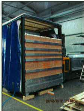
Heckwand mit XL PIN