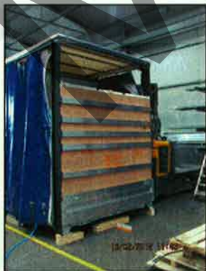
Heckwand mit XL PIN