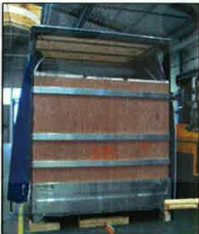
Heckwand mit XL PIN