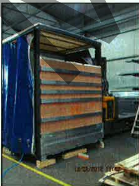
Heckwand mit XL PIN